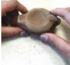
Fabrication d'une lampe à huile

Activité qui permet aux enfants de fabriquer une lampe à huile à partir d'un moule ainsi qu'une fibule (broche), objets symboles de l'époque gallo-romaine, qu'ils emportent avec eux à la fin de la journée.